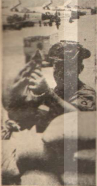
Vietnamda bir Amerikalı «Ya bu deve güdülür...»

Darbenin dışında kalan fakat sonradan «Biz sömürge değiliz» şeklinde bir çıkış yaparak genç generalleri destekleyen Silâhlı Kuvvetler Başkomutanı, eski Basbakan General Han, General Taylor'un bir işgal kuvvetleri komutanı üslubuyla davranışını şöyle anlatıyordu: «General Taylorun son 48 saatteki hareketlerini benim ufak kafam almıyor... Bunu bir gün Amerikan ve Vietnam halklarına açıklayacağım.»