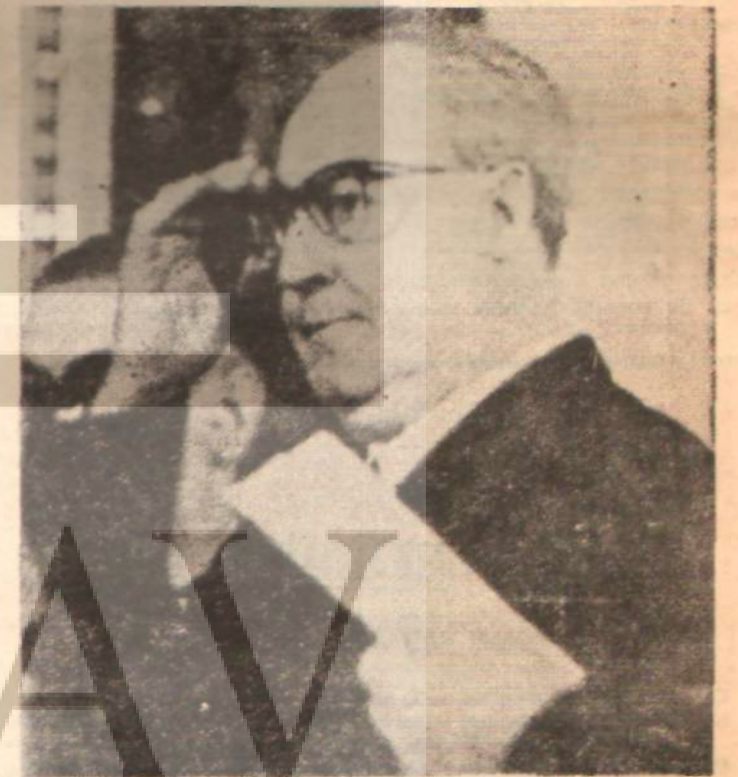
İtalya Cumhurbaşkanı Saragat İleri unsurları birleştirdi.

Kerala ve Pencap'taki iki teşkilatımız sağlık merkezleri kurdu; gençler, bu merkezlerde, parasız tedavi görürler.