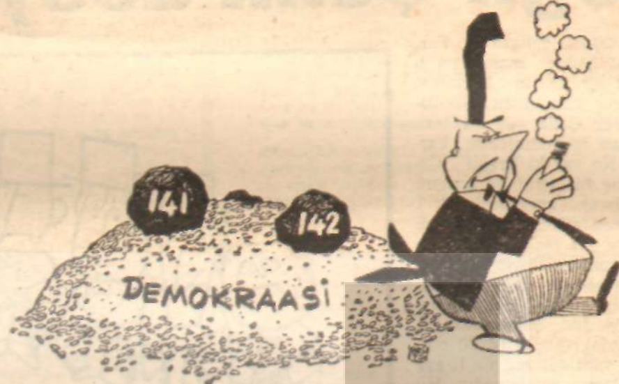
AYIKLA BİRİNCİN TAŞINI.

Siyasî mahiyet arz eden böyle bir toplantıda bulunan ve kongre başkanlığına seçilerek 70 bin öğretmen adına kendisinde konuşma yetkisini bulan, 141 ve 142 nci maddelerin kaldırılması tezini savunan İbrahim Türk, bu hareketleri ile memur olmasına rağmen